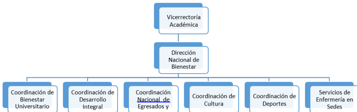
Figura 2 Organigrama Bienestar Universitario